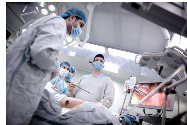
НМИЦ Радиологии, МНИОИ им.Герцена, Москва