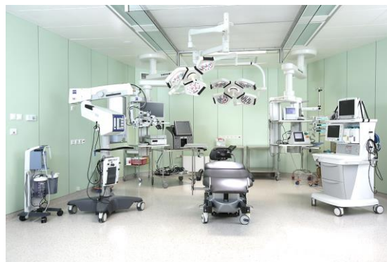
Клиника Скандинавия, С.Петербург