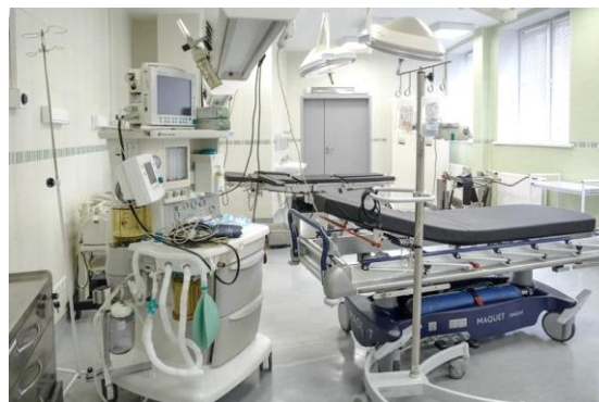
Центр экстренной медицины им.Никифорова, С.Петербург